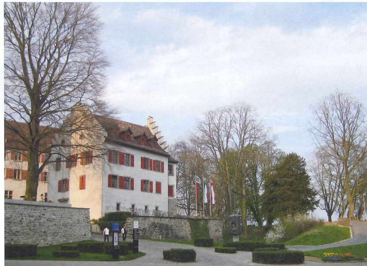
Schloss Arbon mit aufgewertetem Naherholungsraum (links).

Simone Hänggi und Clemens Basler ging es in ihrem Gestaltungsvorschlag primär darum, die verborgenen Qualitäten des Schlosshügels mithilfe subtiler Eingriffe herauszuschälen und sichtbar zu machen. Die kümmerliche Rasenfläche und die verwilderten Gehölzrabatten wurden mit einem weitläufigen Kiesplatz ersetzt. Gefällt wurden standortgerechte Bäume, zum Beispiel Pappeln, und Gehölze wurden aufgeastet. Auf diese Weise stellte man bedeutende Sichtachsen